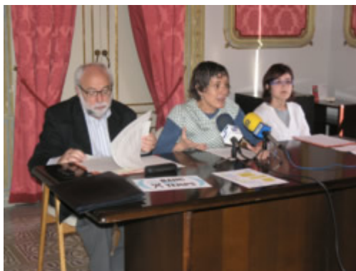
Rueda de prensa con motivo de la presentación del BANCO DEL TIEMPO

Además de los vecinos/as del barrio, la inscripción de personas llegadas al municipio recientemente de procedencias diversas (Perú, Argentina, Uruguay, Canadá, EE.UU., África e Italia) permite augurar una diversidad de intercambios muy interesante, además de convertirse en un punto de encuentro ideal para que las personas inscritas se conozcan y se den a conocer.