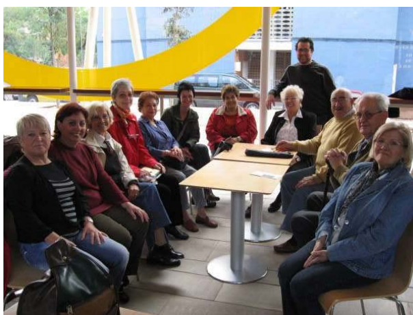
El BdT de Gavà organizó una visita al Parc Temàtic Mines de Gavà con usuarios/as de los Bdt de la red.

Asimismo, su participación en las fiestas populares del municipio, dan visibilidad a un proyecto de mejora de convivencia, resaltando los valores de las personas que participan en el mismo.