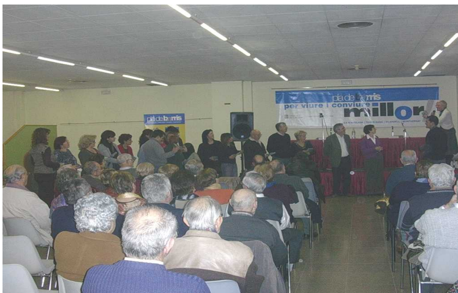
Fotografía del acto de celebración del primer aniversario del BdT de Terrassa

También se han organizado 5 encuentros de usuarios/as. Estos encuentros afianzan la confianza entre las personas y potencian el aumento de los intercambios, utilizándose asimismo para recibir nuevas propuestas de actividades.