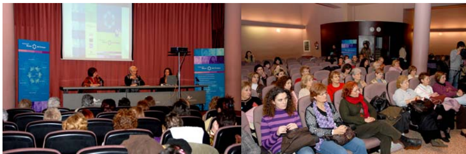
Imágenes de la inauguració del Banco del Tiempo de Badalona, realizada en el Museo (2007)

Los encuentros de usuarios/as realizados por el BdT de Badalona, han permitido ampliar en poco tiempo el número de personas inscritas en su secretaría, demostrando una vez más que la confianza entre los/las participantes se consolida, participando en las charlas, talleres, etc. y abriendo posibilidades a otras líneas de actividad, como es el caso de los intercambios entre Bancos del Tiempo, tanto a nivel nacional como internacional.